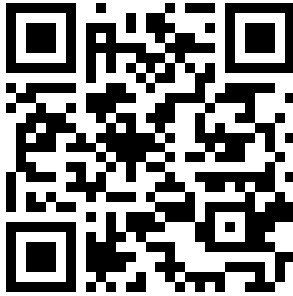
MTV Vorsfelde App

Hier könnt ihr unsere MTV APP herunterladen und uns auf Instagram folgen: